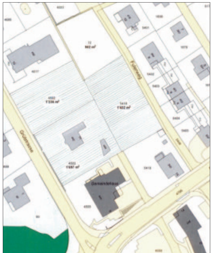
Die drei schraffierten Grundstücke zwischen Gemeindehaus und Schrebergärten (72) stehen zum Verkauf

Den drei Parzellen an zentraler Lage kommt vor allem wegen der Grenze zum Gemeindehaus grosse strategische Bedeutung zu. Zudem besitzt die Gemeinde am Fulerweg ein Grundstück mit 942 m 2 Fläche. Dieses hatte die Gemeinde 1977 als Vermächtnis erhalten und der Wert wurde gemäss Gemeindeversammlungsbeschluss vom 27. November 1991 im Sinne des Testaments für den Bau des Alters- und Pflegeheimes "Im Rebberg" verwendet. Zurzeit kann nicht konkret gesagt werden, wie dieses Land später genutzt würde. Neben künftigen Bedürfnissen der Gemeindeverwaltung - wo bekanntlich Besucherparkplätze fehlen bzw. nur provisorisch auf dem Postparkplatz zur Verfügung stehen - sind andere öffentliche Nutzungen denkbar. Die zentrale Lage in Nähe zur Post, zum Bahnhof und zum Coop sprechen für sich. Landreserven sind zudem wichtig, um allenfalls bei anderen Gelegenheiten Tauschobjekte anbieten zu können. Vor allem ist zu bedenken, dass die Chance an solcher Lage, falls überhaupt, nicht so schnell wieder kommt. Ein Verkauf an einen privaten Investor hätte mit grösster Wahrscheinlichkeit unverzüglich eine Überbauung zur Folge. Die Chance ist von der Gemeinde unter dem Motto "jetzt oder nie" wahrzunehmen.