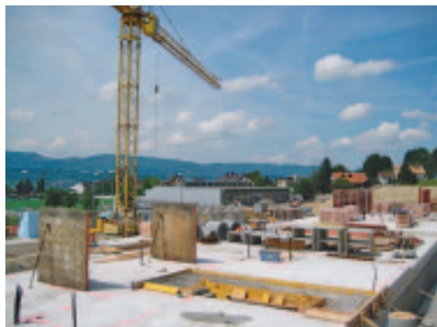
Baustelle Schützenmur am 16.5.08

Die Gemeindeversammlung hat am 8. Februar 2006 einen Baurechtsvertrag mit der Siedlungsbaugenossenschaft Herrliberg abgeschlossen. Rund 12'500 m 2 wurden im Baurecht abgetreten. Die Überbauung sieht 9 Häuser mit je vier Wohneinheiten vor. Etwa im April 2009 können die ersten MieterInnen einziehen. Im April 2010 sollten alle Häuser erstellt sein. Ursprünglich wurde mit Gesamtbaukosten von rund 17.5 Mio. Franken gerechnet.