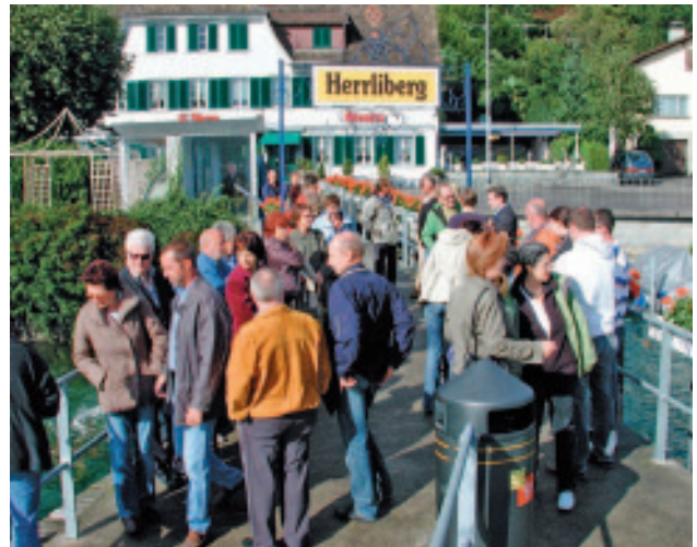
Der Gewerbeverein Herrliberg bei guter Laune am Schiffssteg, kurz vor der Sommerschiffahrt nach Rapperswil.

Auf das einheimische Gewerbe ist Verlass. Die Leute sind vor Ort, die Beratung ist persönlich, die Motivation für eine qualitativ gute Erledigung des Auftrages ist gross und für allfällige Zusatzdienste ist der Anbieter vor Ort oder man trifft sich eh im Dorf. Die Mitglieder des Gewerbevereins sind mehr als reine Geschäftspartner. Sie engagieren sich für das Dorfleben und bereichern den Alltag von Alt und Jung. Marktstimmung kommt am Frühlings- und Herbstmarkt auf. Der alle zwei Jahre stattfindende Seniorenausflug (Zusammenarbeit mit der Gemeinde) erfreut die älteren Einwohner. Der Samichlaus bringt nicht nur "Öpfel und Bire" sondern auch 10% Rabatt in zahlreichen Geschäften. Aber auch die Weihnachtsbeleuchtung und das Gemeindetelefonbuch (beides mit der Unterstützung der Gemeinde) und die alle paar Jahre stattfindende Gewerbeausstellung (HEGA) bereichern das Dorfleben.