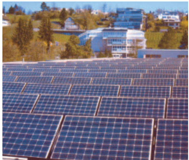
Fotomontage / Die 180 Solarmodule auf dem Dach des Schulhauses Breiti würden nach Süden ausgerichtet.

Aus ökologischen Gründen beauftragte der Gemeinderat das Elektrizitätswerk Herrliberg in Koordination mit der Energiekommission, Projektierungsarbeiten zur Erstellung einer Photovoltaikanlage auf dem Schulhaus Breiti aufzunehmen. Als mögliches Ziel sollte geprüft werden, ob der von den Herrliberger Stromkunden jährlich bestellte Solarstrom auf diese Weise in Herrliberg selbst erzeugt werden kann.