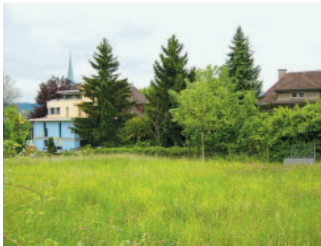
Grundstücke in unmittelbarer Nähe des Gemeindehauses zu kaufen

Die Parzellen liegen in der zweigeschossigen Wohnzone (W2/30) mit einer Ausnützungsziffer von 30 %, was gesamthaft bei einer Arealüberbauung eine maximale Ausnützung von 40 % ermöglichen würde. Diese Ausnützung ist für den Dorfkern eher tief und gilt nur im Bereich zwischen Pfarrgasse, Glärnisch- und Grütstrasse. An der Gartenstrasse könnte z.B. bei gleicher Grundstückfläche mit einer Arealüberbauung eine Ausnützung von 65 % erreicht werden. Diese Tatsache wirkt sich auf den Landpreis leicht reduzierend aus. Andererseits sind die Landpreise in den letzten Jahren in Herrliberg gestiegen und liegen aktuell für Bauland in der Regel zwischen 1'500 und 3'000 Franken pro m 2 . Von diesen Zahlen ausgenommen sind Seegrundstücke, wofür Liebhaberpreise bezahlt werden. Die Bewertung des Landes kann unterschiedlich erfolgen, indem auch das Gebäude Forchstrasse 11 einbezogen oder nur das Land angerechnet wird. Das vom Architekten des Gemeindehauses 1927 zwei Jahre nach dem Gemeindehaus erstellte Gebäude "Schöngrund" weist den gleichen Charakter auf. Es ist nicht inventarisiert und eine Schutzverfügung steht nicht zur Diskussion.